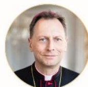
MIT ERZBISCHOF HERWIG GÖSSL